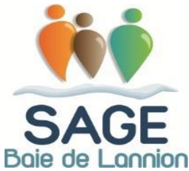
Schéma d'Aménagement et de Gestion des Eaux de la Baie de Lannion